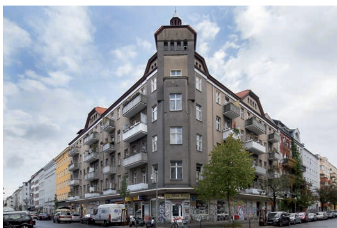
Berlin, Eisenbahnstr. 2-3 / Muskauer Straße (Mietshaus)

Auktionslimit € 3.450.000,- Auktionserlös € 3.510.000,-