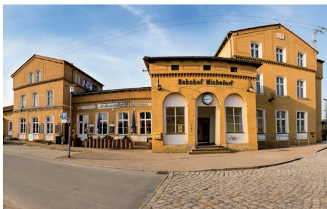
Michendorf, Bahnhofstraße (Bahnhof)

Auktionslimit € 5.200.000,- Auktionserlös € 7.160.000,-