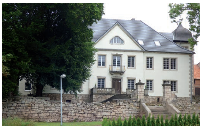
Buhla, Friedensstraße (Schloss)

Auktionslimit € 98.000,- Auktionserlös € 313.000,-