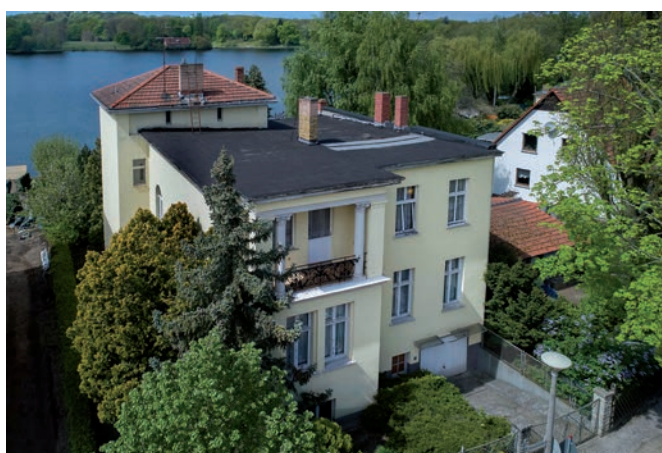
Potsdam, Seestraße 26 (Wassergrundstück)